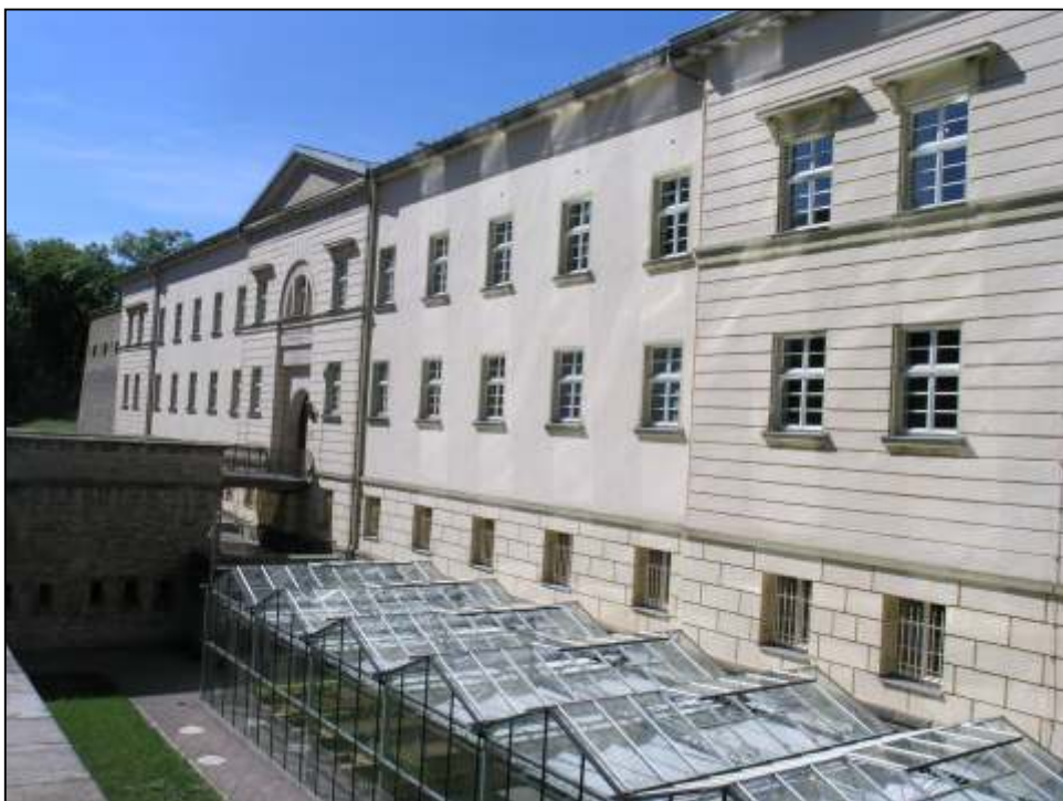
Das Deutsche Gartenbaumuseum in der denkmalgeschützten Cyriaksburg

Stiftung Deutsches Gartenbaumuseum Erfurt Cyriaksburg Gothaer Straße 50 99094 Erfurt