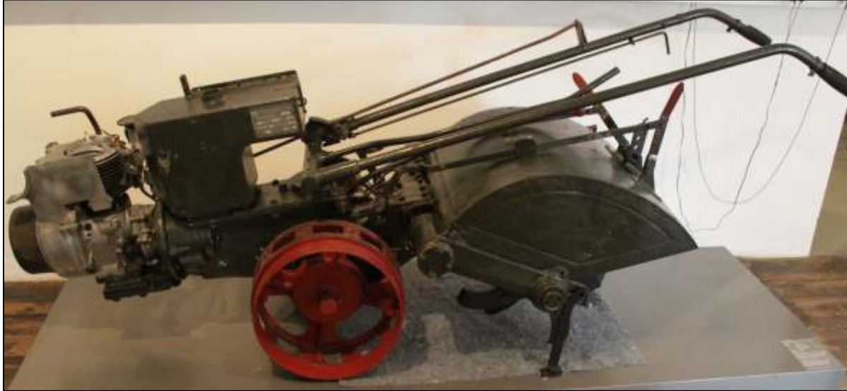
Restaurierte Motorgartenfräse aus den 1940er Jahren

Bitte an umseitige Adresse senden oder unter der Fax-Nr. 03 61 / 2 23 99 13